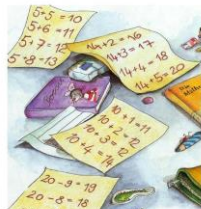
Die Matheprofis 1